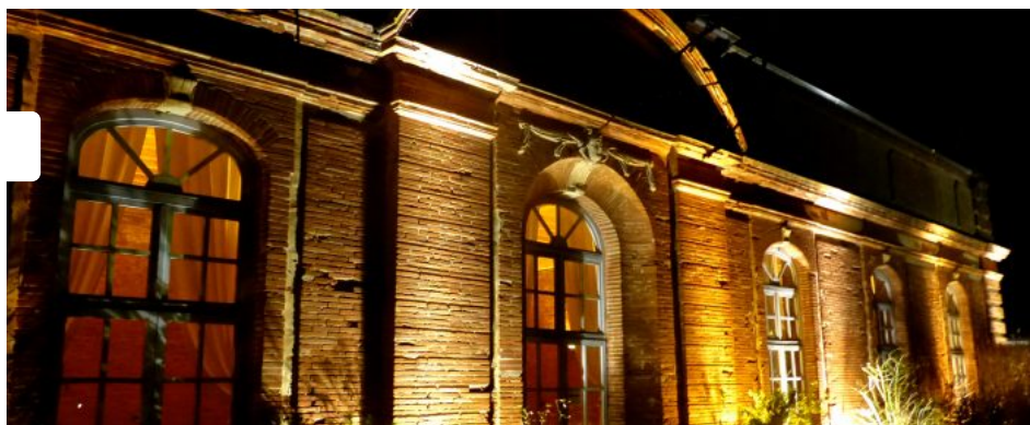
L'Orangerie de Rochemontès

Accueil » Musique » Classique » Dernier dimanche à la campagne à l'Orangerie de Rochemontès